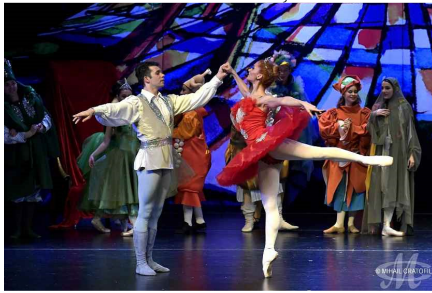
Harap Alb și fata lui Roș Împărat