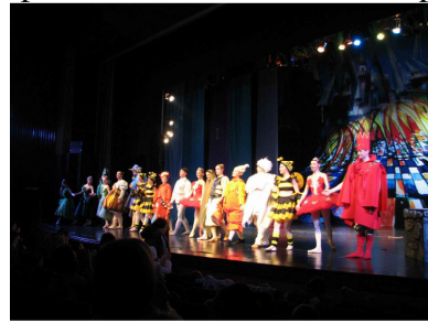
Aplauze pentru HARAP ALB

În privința muzicii, eclecticul colaj a purtat spectatorii pe aripile diverselor stiluri, de la rock la... baroc, de la sonuri Vivaldi – sau Mozart-like la romantice și înapoi la rock.