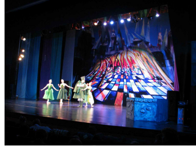
Harap Alb la curtea lui Verde Împărat